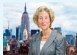
Judge Shira Scheindlin Ex US Federal Judge, SDNY